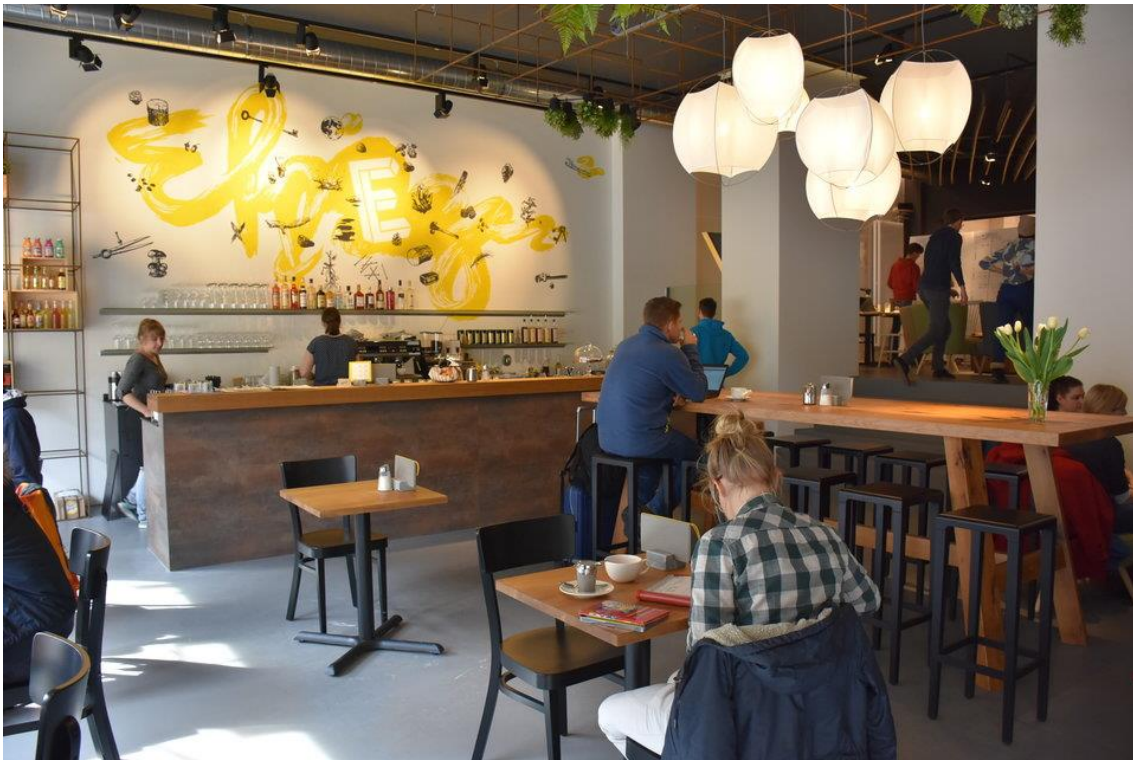
Das Lokal verfügt über eine Kaffeebar...