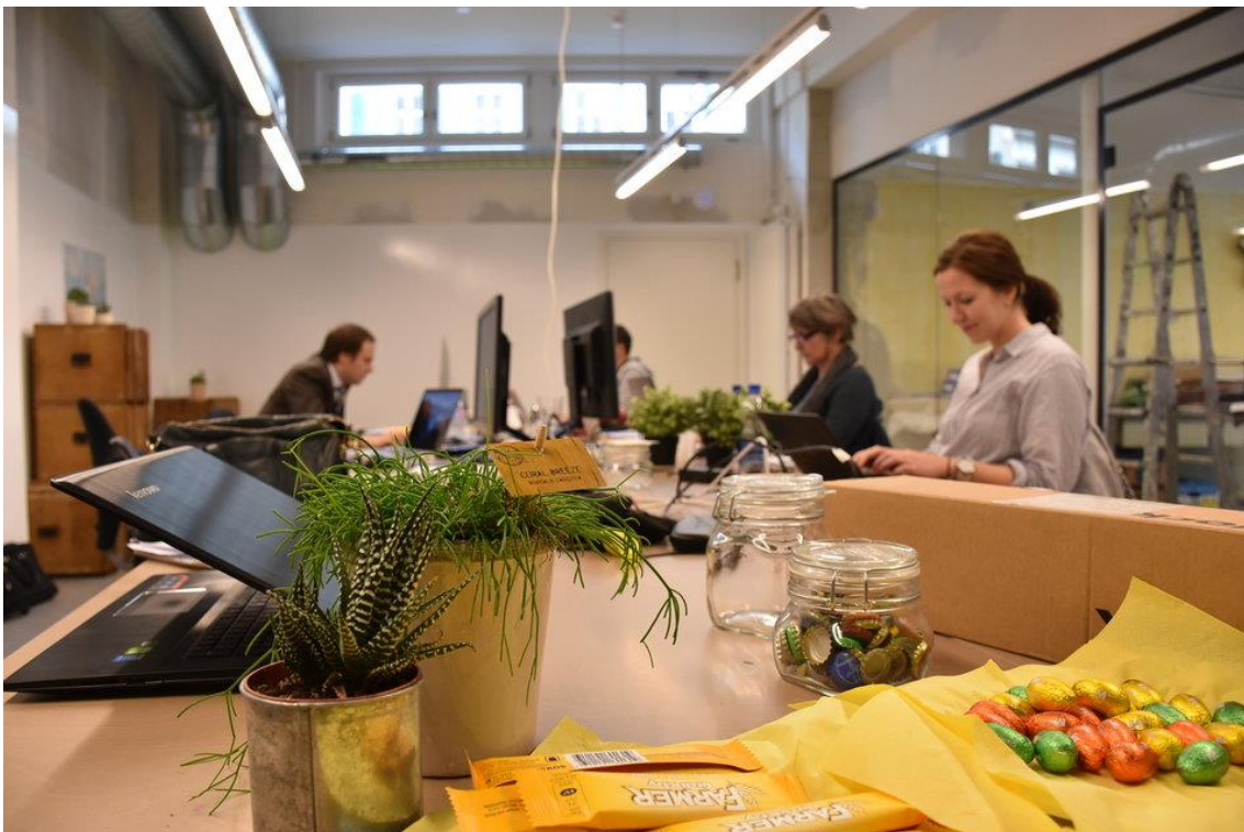
..und ein Gemeinschaftsbüro, wo Interessierte für 30 Franken pro Tag einen Arbeitsplatz samt Computer, Internet und Drucker erhalten.